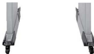
◀ Ruote universali