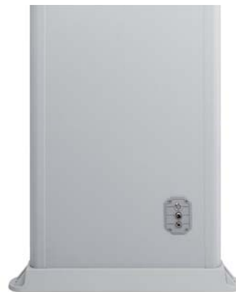
◀ Alimentazione e collegamenti linkage