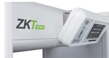
◀ Staffa di metallo