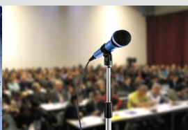
Gestione delle conferenze