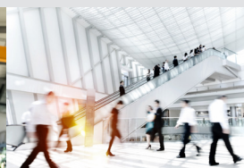
Gestione dei visitatori